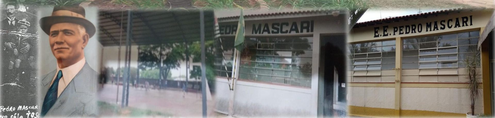
Pedro MASCARI no cêlo 705